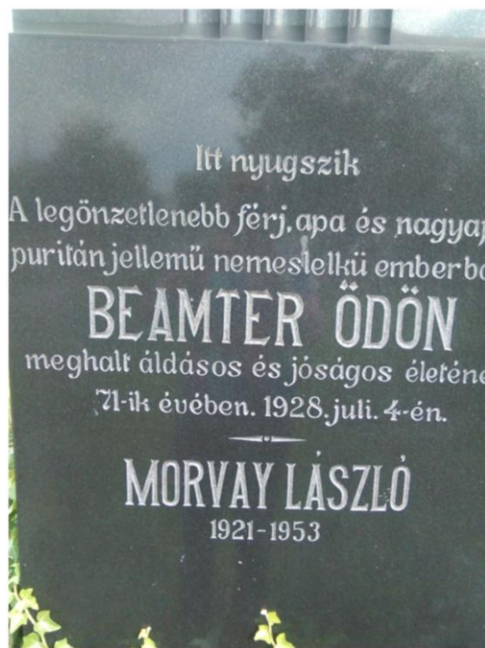
Piatra funerară a lui Beamter