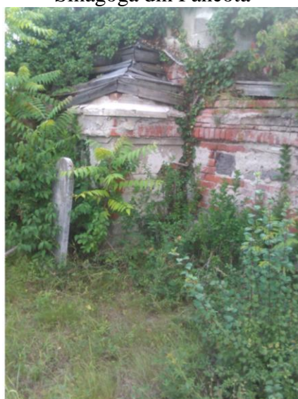
Ruinele capelei evreiești din Pâncota