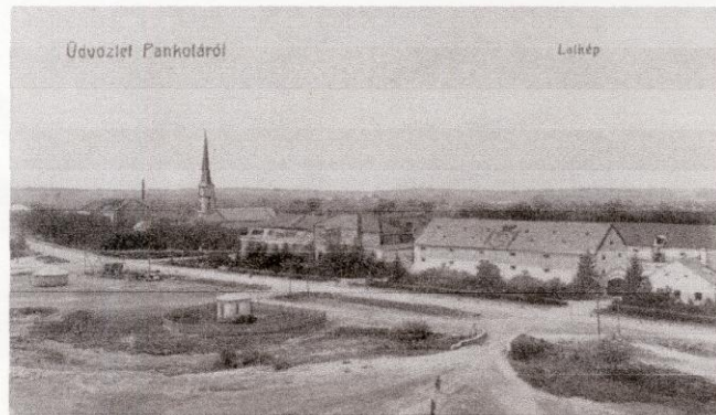
Pâncota la început de secol XX