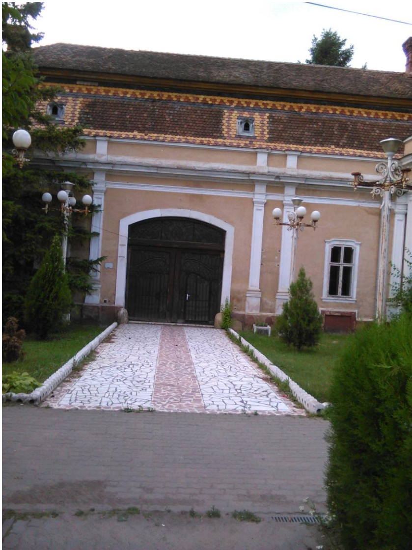
Castelul Dietrich – Sukowsky din Pâncota