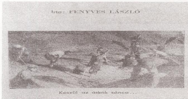
Construirea Canalului Matca cu evrei deportați – detașamentul 101 Pncota ( 1941 – 1944)