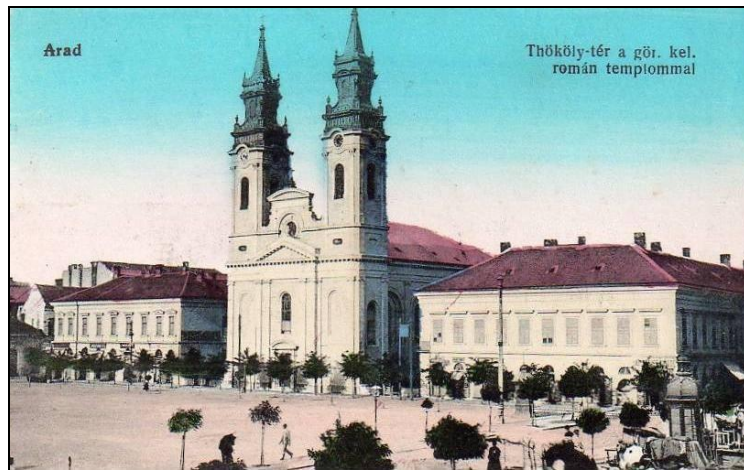
Catedrala „veche” (Parohia Arad-centru)

Punerea pietrei de temelie a coincis cu începerea lucrărilor de construcție în vremea episcopului Procopie Ivașcoviți al Aradului, act înfăptuit în anul 1861, iar în 1865 Biserica Catedrală a fost finalizată, serbându-se reactivarea Mitropoliei Ortodoxe a Transilvaniei dar și alipirea unei părți din Banat la Episcopia Aradului. Biserica va avea hramul Nașterea Sfântului Ian Botezătorul .