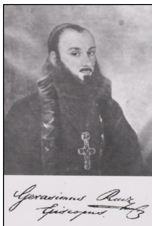
Semnătura Episcopului Gherasim Raț al Aradului

sfintele slujbe cu regularitate, iar la Sfânta Liturghie dacă nu vor rosti predicile să citească „totdeauna Cazania la norod” 27 .